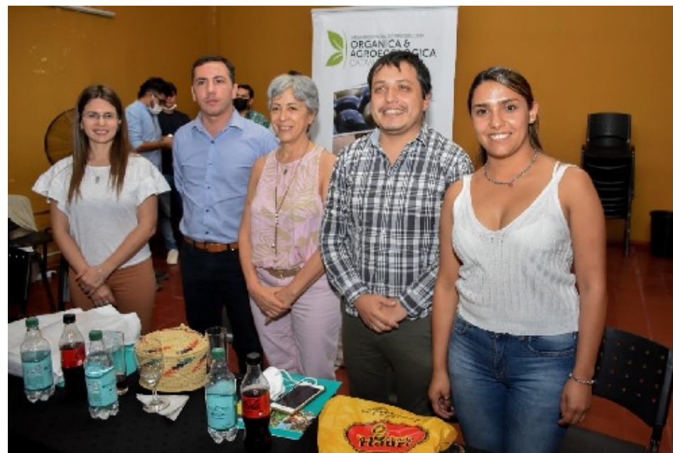
La CIAO participó de la Reunión de la Comisión Asesora para la Producción Orgánica de Argentina en Catamarca