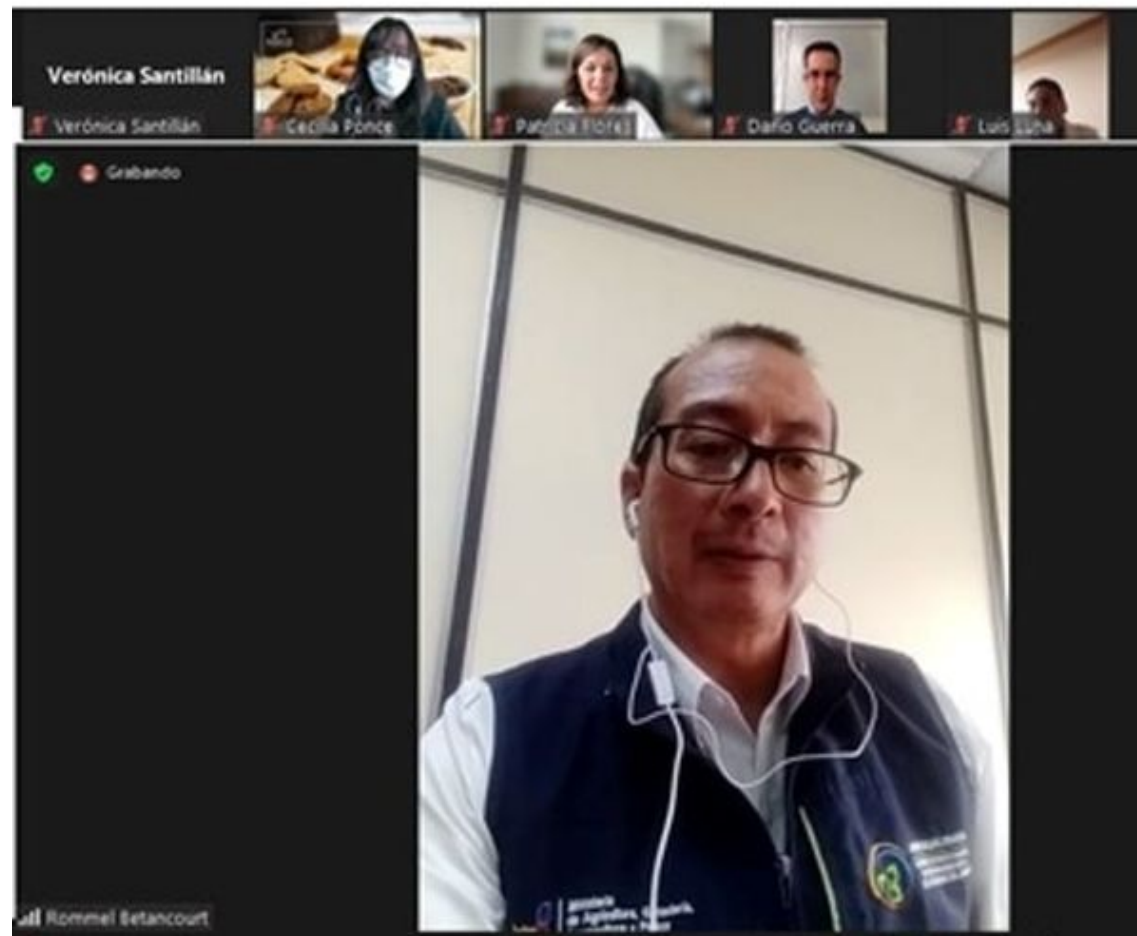
La CIAO participó del cierre del Organic Leadership Course - OLC