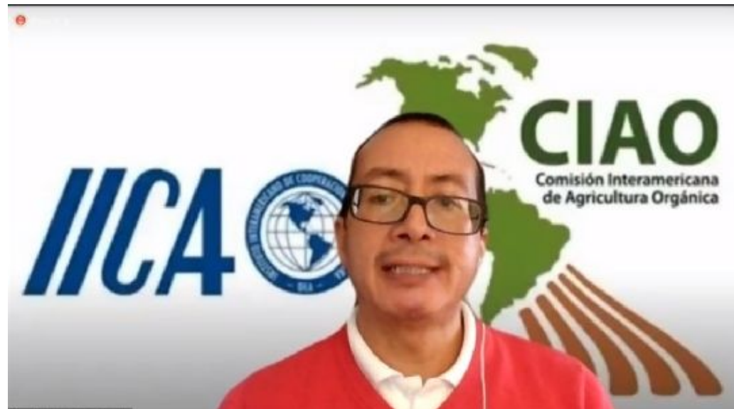
La CIAO disertó en el Simposio Internacional de Horticultura Orgánica